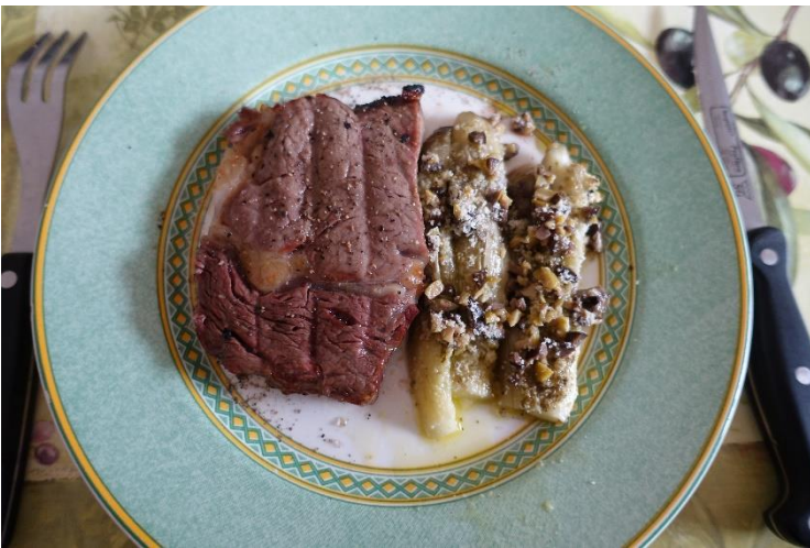
ビーフステーキ なすのグリル添え